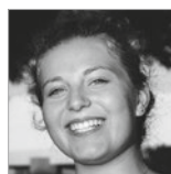
SIMEA MERKI Publishing Beratung