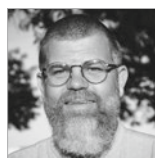
HAEME ULRICH Publishing Beratung