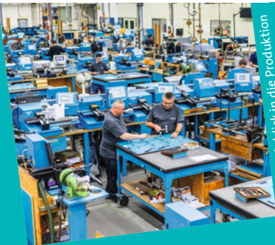
Marbach: Einblick in die Produktion