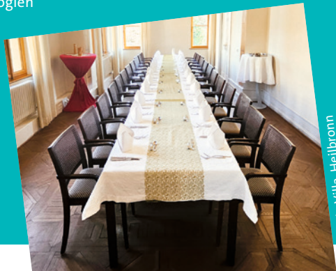
Wein Villa, Heilbronn