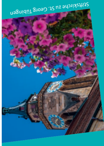
Stiftskirche zu St. Georg Tübingen

Wir freuen uns auf Ihre Teilnahme und einen inspirierenden Nachmittag und Abend voller Genuss, Austausch und Networking!