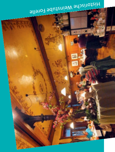
Historische Weinstube Forelle